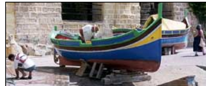
Fiskare i St Julian's.

Caprese är gott, vare sig du äter det som förrätt eller huvudrätt. Tomater, mozzarella, oliver och basilika i olivolja.