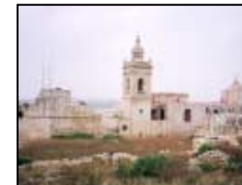
Citadellet i Victoria

Ett alternativ till Maltas folktäta stränder är denna Gozos