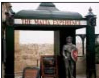
På The Malta Experience i Valletta får du reda på mer om Maltas historia.

den tysk-romerske kejsaren Karl V. Lokalbefolkningen accepterade dem när de kunde sluta upp mot turkarna, och klara sig genom den långa belägringen av Malta 1565. Johanniterna tvingas bort från ön