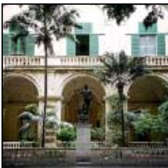
På Stormästarpalatsets innergård finns många fina statyer och växter.

Varje söndag är det marknad nedanför St James Cavalier. Marknaden är populär bland turister, och här kan du fynda bland stånden som säljer böcker, cd-skivor, kläder, hantverk, kuriosa, second hand och mycket annat.