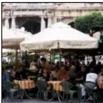
Republic Square med sina caféer och restauranter.