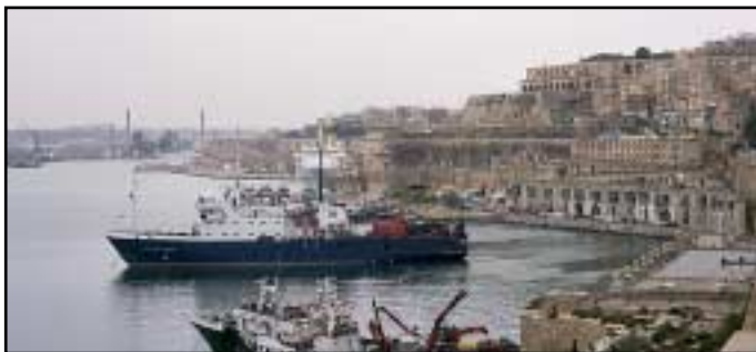
Vallettas hamn, med de tre städerna i bakgrunden.

Vallettas hamn ser man bäst från Upper Baracca Gardens , en liten anlagd trädgård med statyer och pelarvalv, eller om