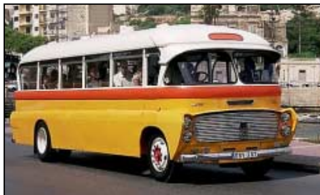
Maltas bussar är gamla men välskötta.

■ ■ Färgglada lastbilar Lastbilar med snirkliga dekorationer som påminner om bussarnas.