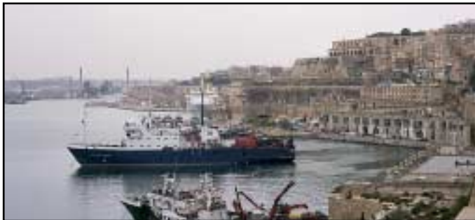
Vallettas hamn, med de tre städerna i bakgrunden.

Vallettas hamn ser man bäst från Upper Baracca Gardens , en liten anlagd trädgård med statyer och pelarvalv, eller om