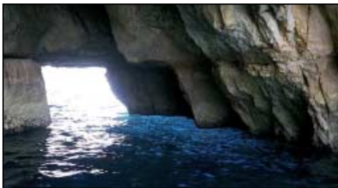
Microorganismer gör att vattnet i Blå Grottan är klarblått.

■ ■ Anchor Bay Anchor Bay vid Popeye villa-ge. Här kan du se bläckfis-