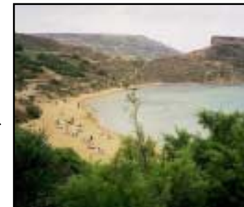
Ghajn Tuffieha Bay ligger lugnt vid sidan av den myllrande stranden Golden Bay.

Ramla Bay är Gozos finaste strand, om än lite svåråtkomlig. En lång sandstrand med fin sand.