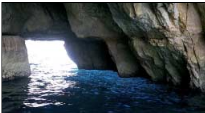
Microorganismer gör att vattnet i Blå Grottan är klarblått.

■ ■ Anchor Bay Anchor Bay vid Popeye villa-ge. Här kan du se bläckfis-