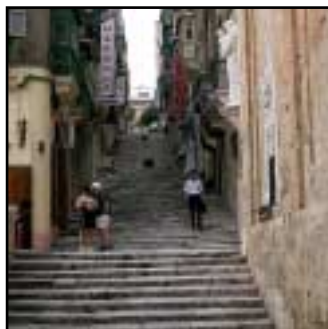
En av Vallettas många trappor. Det är ingen lätt stad för äldre att ta sig runt i.