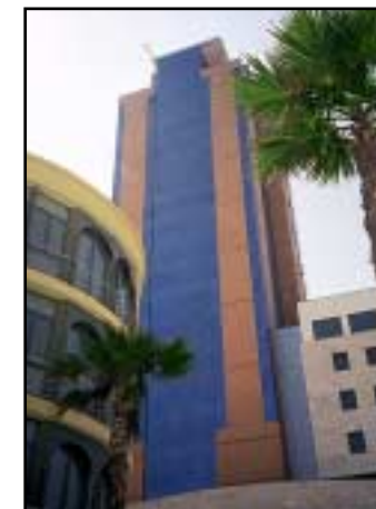
Hilton, högst på Malta.

■ ■ Golden Sands hotell Om strandliv är det du mest längtar efter på semestern ligger Golden Sands hotell perfekt invid den populära stranden Golden Bay. Det går även bussar till Valletta härifrån.