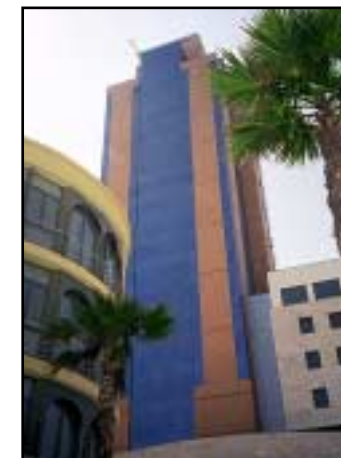
Hilton, högst på Malta.

■ ■ Golden Sands hotell Om strandliv är det du mest längtar efter på semestern ligger Golden Sands hotell perfekt invid den populära stranden Golden Bay. Det går även bussar till Valletta härifrån.