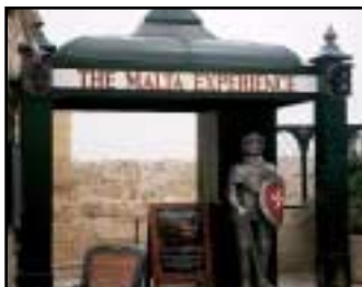
På The Malta Experience i Valletta får du reda på mer om Maltas historia.

den tysk-romerske kejsaren Karl V. Lokalbefolkningen accepterade dem när de kunde sluta upp mot turkarna, och klara sig genom den långa belägringen av Malta 1565. Johanniterna tvingas bort från ön